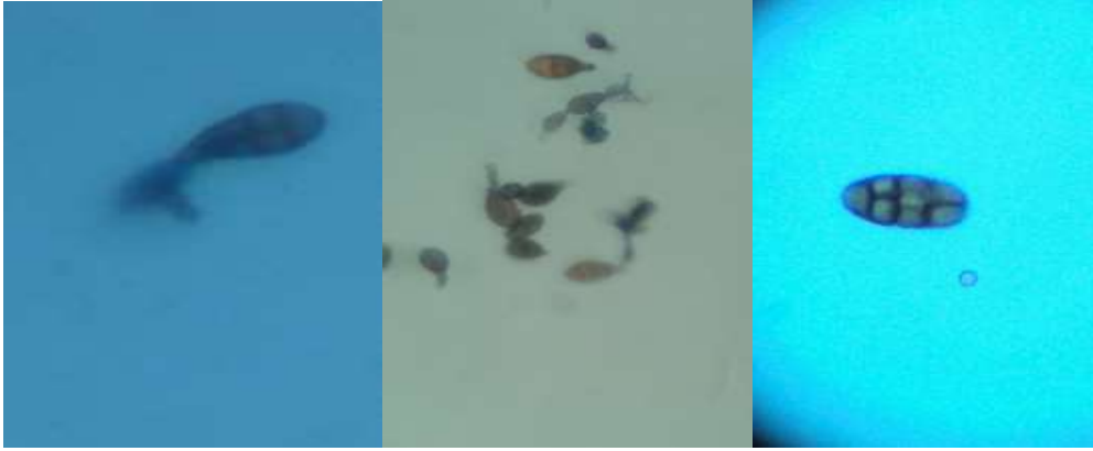
شكل (5): جراثيم الكونيدية المميزة للفطر Alternaria .