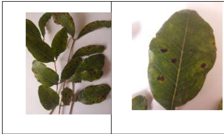
شكل (3) أعراض مرض التبقع على أوراق الخروب

لقد لوحظ أعراض التبقع على عينات أوراق الخروب التي جمعت من اشجار مصابة كما هو موضح في الشكل (3)