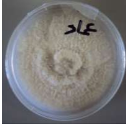
شكل (7) نمو الفطر Hendersonia على بيئة PDA بصورة نقية.

بعد عزل وتنقية الفطر على PDA تم ظهور الفطر كما هو موضح في الشكل 7 وعند الفحص المجهري تحصلنا على الجراثيم الكونيدية المميزة للفطر كما هو موضح في الشكل 8.