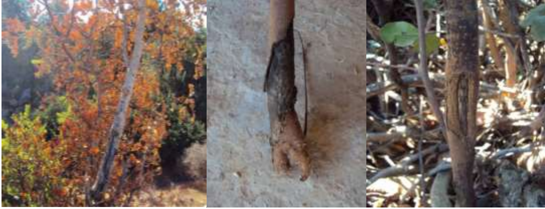
شكل (6) أعراض التفرح على أفرع الخروب.

بعد عزل وتنقية الفطر على PDA تم ظهور الفطر كما هو موضح في الشكل 7 وعند الفحص المجهري تحصلنا على الجراثيم الكونيدية المميزة للفطر كما هو موضح في الشكل 8.