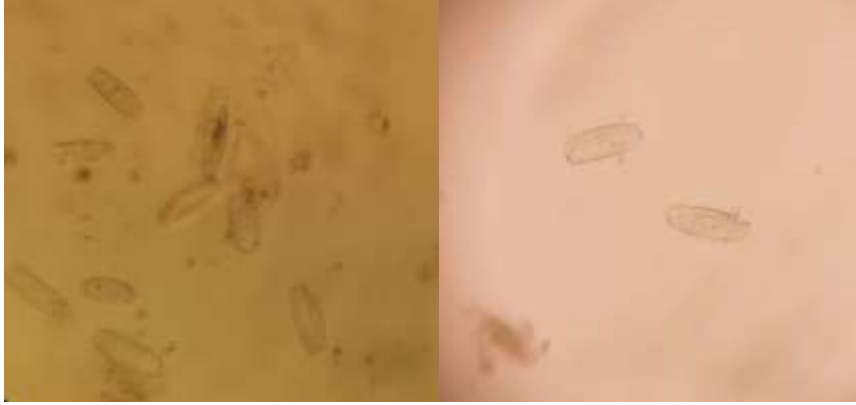
شكل (2) الجراثيم الكونيدية للفطر

بعد اعداد شرائح من نموات الفطر التي ظهرت على سطح الاوراق وصبغها وفحصها تحت المجهر تبين أن الفطر له جراثيم كونيدية برميلية الشكل كما هو موضح في الشكل (2).