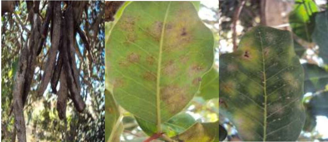
شكل (1) أعراض مرض البياض الدقيقي على اوراق وقرون شجرة الخروب

عند معاينة الاوراق والقرون التي احضرت من الاشجار المصابة بالبياض الدقيقي لوحظ اعراض مرض البياض الدقيقي على اوراق وقرون الخروب كما هو موضح في الشكل (1)